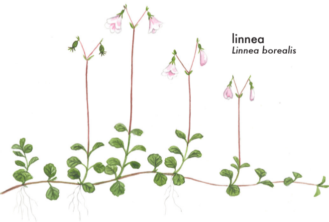
linnea Linnea borealis

7. OXHAGEN , Berg, Skövde kn (58,4965/13,7967). 2,9 ha. Gammal hagmark med ekar och lindar utgörande del av Bergs ängar. Vägbeskrivning: Från Skövde, kör väg 48 mot Mariestad. Efter 5 km sväng vänster mot Säter och Timmersdala. Efter ytterligare 6 km sväng vänster vid Övertorp mot Berg. Efter ca 1,5 km finns vägslykt och p-plats på vänster sida.