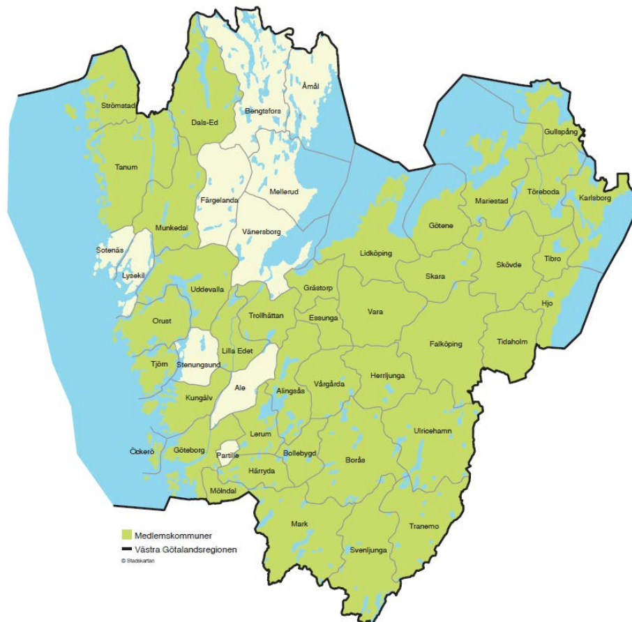
Figur 1 Karta över medlemsorganisationerna

Tolkförmedling Väst har varit i drift sedan 1 april 2013 och bildades av Västra Götalandsregionen, Göteborgs Stad, samt kommunerna Borås, Mariestad, Trollhättan och Uddevalla. I januari 2015 utökades förbundet med 28 nya medlemskommuner. Ytterligare 12 nya medlemskommuner tillkom januari 2019. Förbundet består nu av totalt 40 medlemmar; Västra Götalandsregionen samt kommunerna Alingsås, Borås, Bollebygd, Dals-Ed, Essunga, Falköping, Grästorp, Gullspång, Göteborg, Götene, Herrljunga, Hjo, Härryda, Karlsborg, Kungälv, Lerum, Lidköping, Lilla Edet, Mariestad, Mark, Munkedal, Mölndal, Orust, Skara, Skövde, Strömstad, Svenljunga, Tanum, Tibro, Tidaholm, Tjörn, Tranemo, Trollhättan, Töreboda, Uddevalla, Ulricehamn, Vara, Vårgårda och Öckerö.