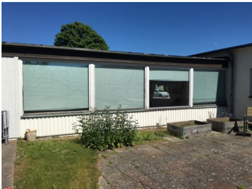
Fasad mot innergård.