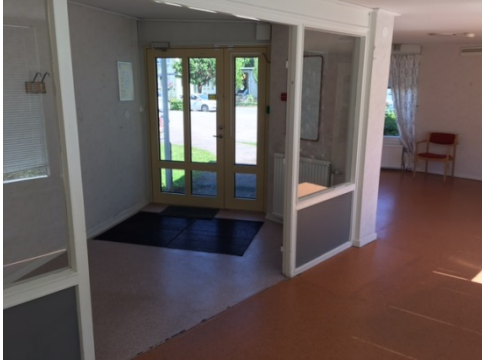
Inside av passagegång.