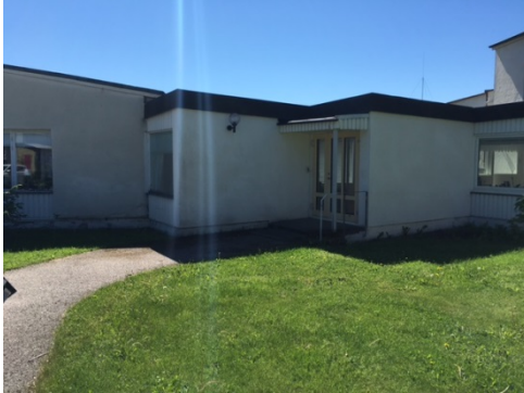
Fasad mot parkering.